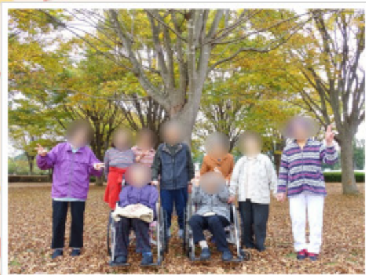
▲ 11月4日(土) ふれあいの森にて