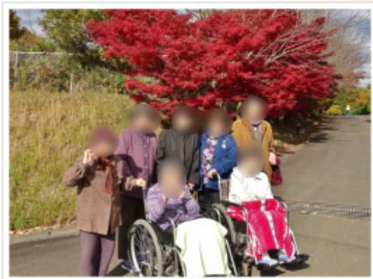
▲ 11月19日(日) ケアセンター阿見にて