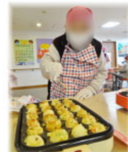
①型に生地を流します。②「たこ」を真ん中に! ③ひっくり返して、完成!